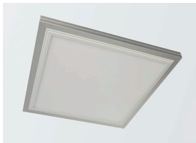
Abb. 3: LED Panel Gemma, weiß 19,8 x 19,8 cm im Aufbau-Montagerahmen