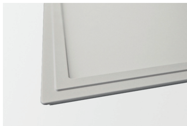
Abb. 2: LED Panel Gemma, Detail Rahmenprofil