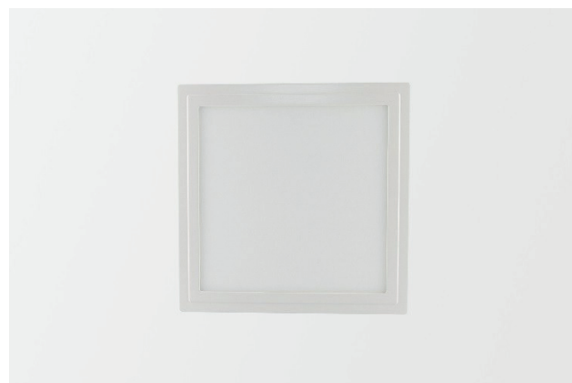
Abb. 1: Lumego Gemma LED-Panel, weiß 19,8 x 19,8 cm

Alle weiteren technischen Merkmale und Daten bezüglich des LED Panels Gemma wie Treiber und Zubehör sind dem jeweiligen Datenblatt zu entnehmen und nach Bauabschluss in der Baudokumentation zusammen mit der jeweiligen Installations- und Betriebsanleitung zu hinterlegen.