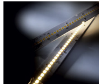
MaxLine 70 Professional LED-Leiste