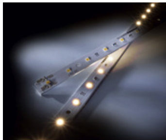
MaxLine 14 Performer LED-Leiste

MaxLine LED-Leisten erhalten Sie wahlweise zum Betrieb mit Konstantspannung für größte Flexibilität im Einsatz oder als Konstantstromvariante für maximale Effizienz.