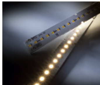
MaxLine 35 Professional LED-Leiste